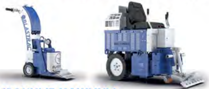
ОБДИРОЧНЫЕ МАШИНЫ ДЛЯ УДАЛЕНИЯ СТАРЫХ ПОЛОВЫХ ПОКРЫТИЙ