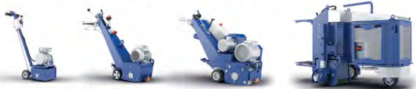
ФРЕЗЕРОВАЛЬНЫЕ МАШИНЫ ДЛЯ ВЫРАВНИВАНИЯ ПОВЕРХНОСТИ И УДАЛЕНИЯ ТОЛСТЫХ СЛОЕВ ПОКРЫТИЙ