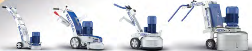
ШЛИФОВАЛЬНЫЕ МАШИНЫ ДЛЯ ШЛИФОВКИ И ПОЛИРОВКИ ЛЮБЫХ ПОВЕРХНОСТЕЙ