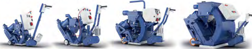
ДРОБЕСТРУЙНЫЕ МАШИНЫ ДЛЯ ОЧИСТКИ ПОВЕРХНОСТИ И НАНЕСЕНИЯ ТЕКСТУРЫ НА АСФАЛЬТЕ И БЕТОНЕ