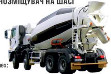
БЕТОНОЗМІШУВАЧ НА ШАСІ