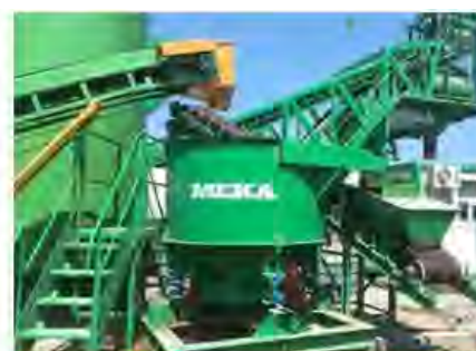
Системы дозирования фибры