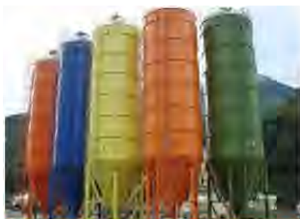
Силосы цемента и связующих