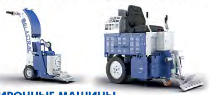
ОБДИРОЧНЫЕ МАШИНЫ ДЛЯ УДАЛЕНИЯ СТАРЫХ ПОЛОВЫХ ПОКРЫТИЙ