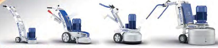
ШЛИФОВАЛЬНЫЕ МАШИНЫ ДЛЯ ШЛИФОВКИ И ПОЛИРОВКИ ЛЮБЫХ ПОВЕРХНОСТЕЙ