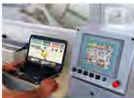
Система автоматизации МЕКА