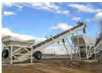
Мобильный конвейер подачи инертных материалов