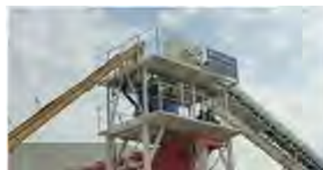
Бетонные заводы для производства ЖБИ