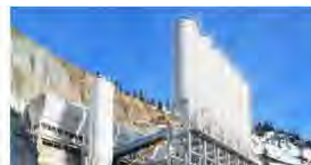
Бетонные заводы для укатываемого бетона

МЕКА не просто производит оборудование, используя новейшие технологии, МЕКА создает решения.