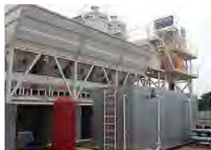
Компоненты и опции