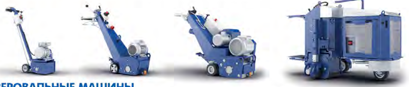
ФРЕЗЕРОВАЛЬНЫЕ МАШИНЫ ДЛЯ ВЫРАВНИВАНИЯ ПОВЕРХНОСТИ И УДАЛЕНИЯ ТОЛСТЫХ СЛОЕВ ПОКРЫТИЙ