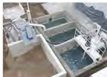
Системы рециклинга бетона

Специализированная компания ITALMACHINERY имеет многолетний опыт работы на рынке Украины и является официальным поставщиком-дистрибьютором строительной техники производства таких ведущих европейских производителей, как MARINI, МЕКА, PI-MAKINA, TekFalt и т.д. Вниманию наших многоуважаемых клиентов мы неизменно предлагаем современную продукцию по наиболее выгодным ценам.