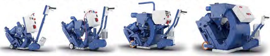
ДРОБЕСТРУЙНЫЕ МАШИНЫ ДЛЯ ОЧИСТКИ ПОВЕРХНОСТИ И НАНЕСЕНИЯ ТЕКСТУРЫ НА АСФАЛЬТЕ И БЕТОНЕ