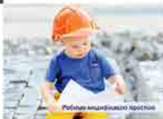
Робить модифікацію простіше