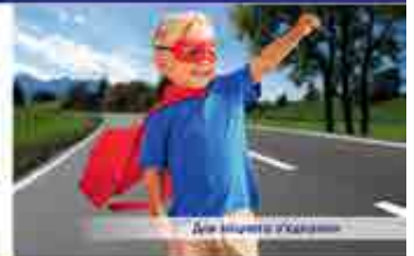
Для швидкого з'їзду