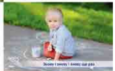
Знову і знову і знову і ще раз