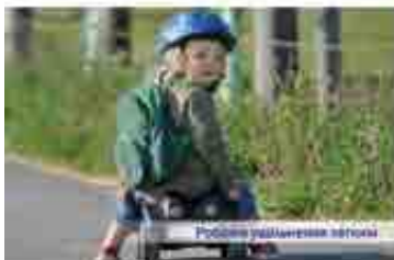
Робить ущільнення легким

Ефективне ущільнення та зниження температури