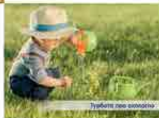
Улюбте своє місце