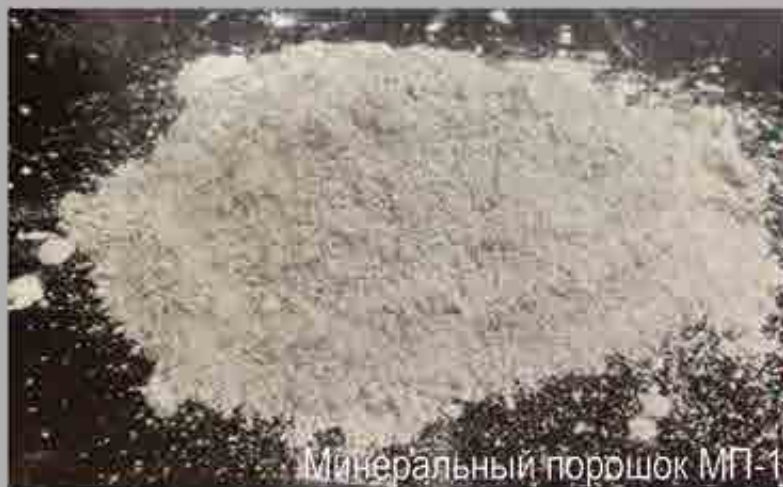
Минеральный порошок МП-1

Услуги сушки и помола минералов, дробление известняка, доломита, кварца, песка, отвального и гранулированного шлака и других сыпучих не пищевых продуктов