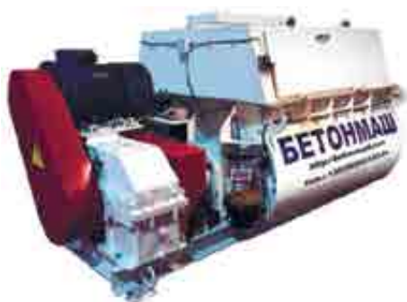
Двовальний бетонозмішувач БП-2Г-1500

призначений для приготування високооднорідних твердих і пластичних бетонних сумішей із крупністю заповнювача до 70 мм на важких і легких заповнювачах, будівельних розчинів і інших сумішей.